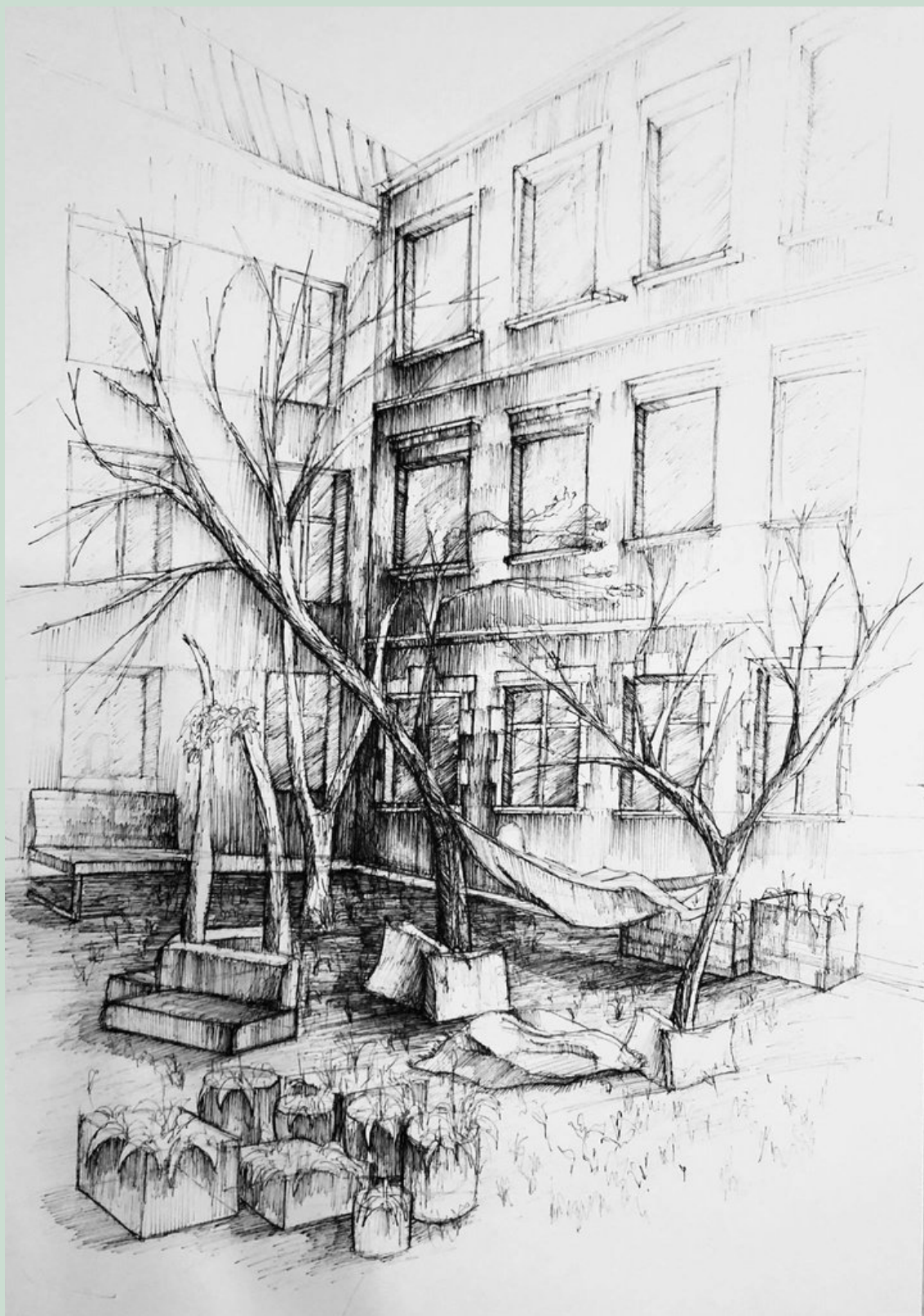
Wizualizacja zagospodarowanego dziedzińca "B"