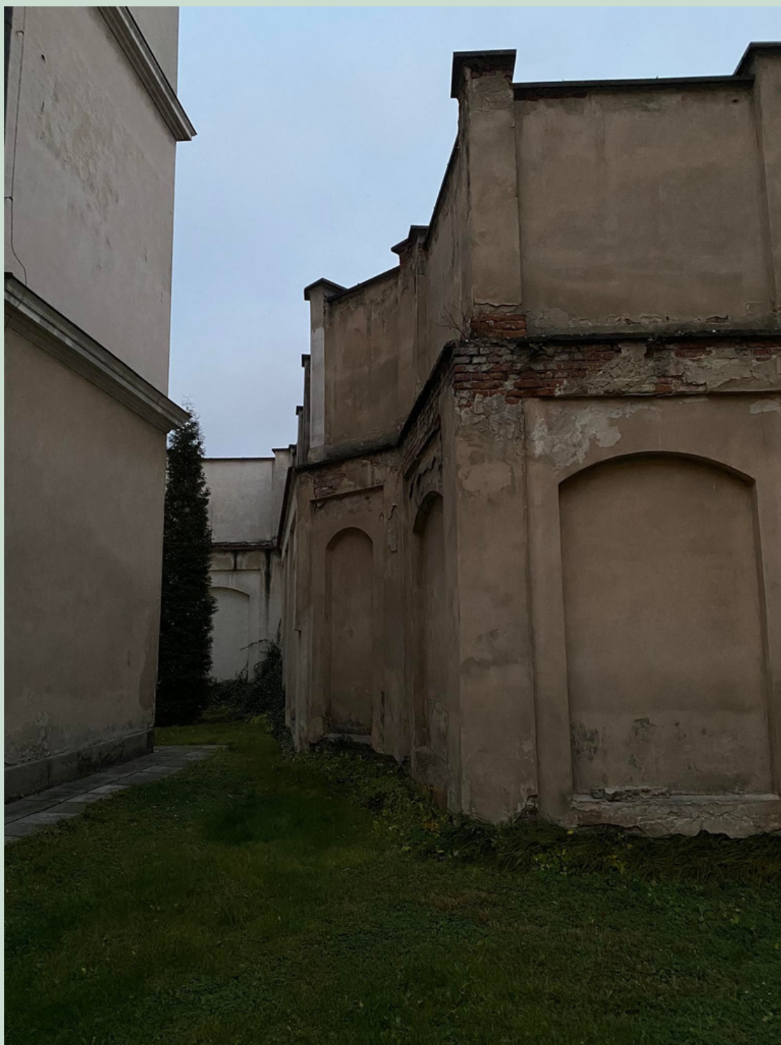
Zdj. 2 Przejście pomiędzy dziedzińcami "A" oraz "B"