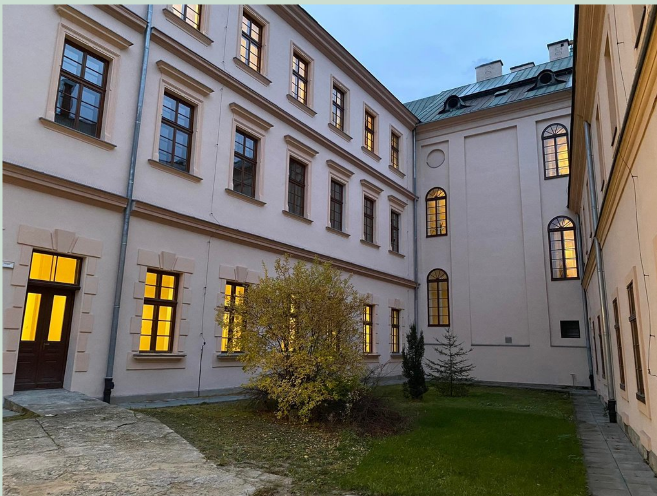
Zdj. 1 Dziedziniec "A" wraz z drzwiami wejściowymi (po lewej stronie)