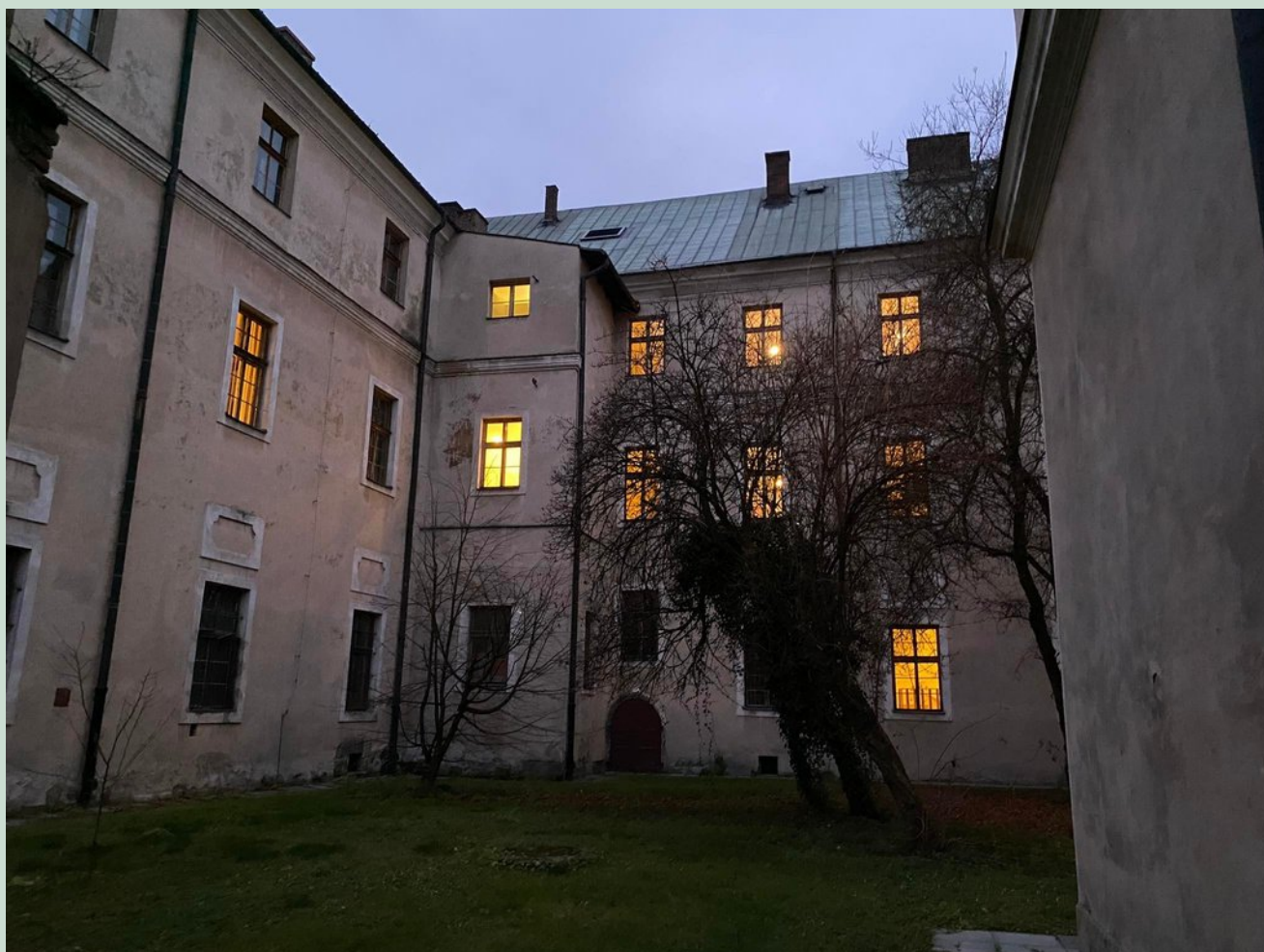
Zdj. 3 Widok ogólny na dziedziniec "B"