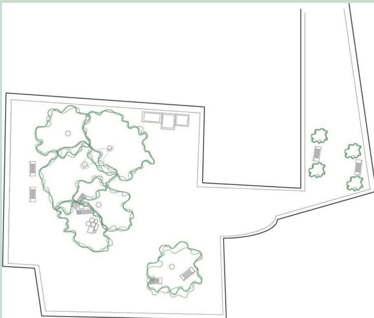
Rys. 2 Projekt zagospodarowania dziedzińca "B"